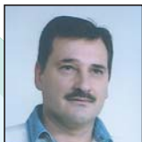
Fernando Frazão C.S.Rª GRANDE