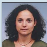
Assunção Nogueira H.S. JOÃO