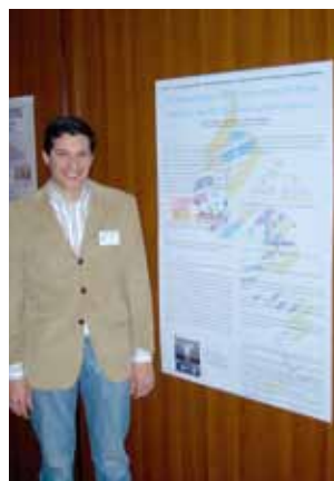
Polimorfismo C-1T na sequência de Kozak da Anexina V e o risco para Enfarte Agudo do Miocárdio