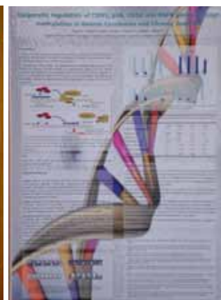
Regulação epigenética por metilação dos genes CDH1, p16, COX2 e EGFR no carcinoma gástrico e gastrite crónica