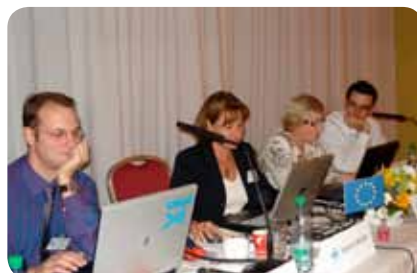
Direcção do EPBS