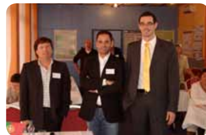
Delegação do SCTS