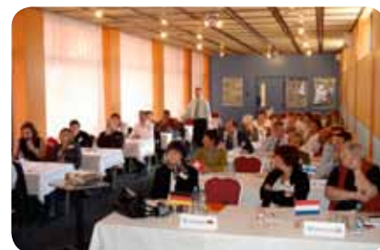
Aspecto da sala de reuniões